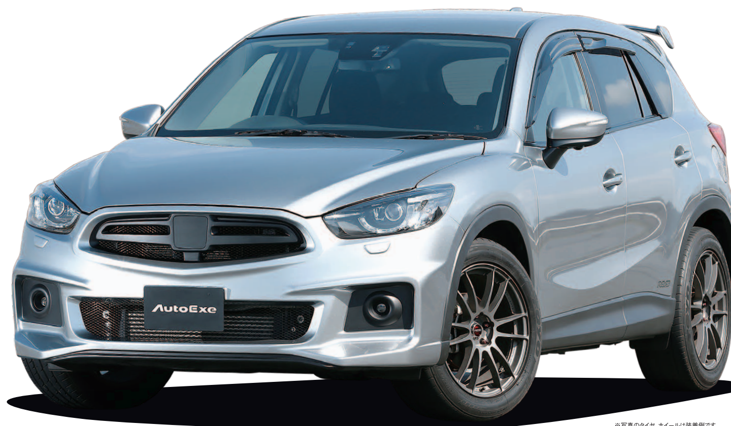
※写真のタイヤ、ホイールは装着例です。

AutoExe第5世代の開発テーマ“Tune COOL!”—それは大人としての知的チューニングを愉しむこと。CX-5チューンの第一人者を自負するAutoExeが贈るストリートスポーツのスピリッツを、ぜひあなたのCX-5にも注いでいただきたい。