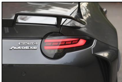
LEDリアコンビネーションライト

ダクトモチーフを取り入れ、風の流れをデザインとして表現。リアセクションにスポーティなアクセントをプラスする。(スノーフレイクホワイトパールマイカ/ソウルレッドクリスタルメタリック/マシングレープレミアムメタリックの塗装済品を設定)