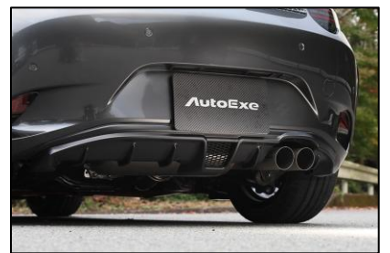
リアアンダーパネル

ワイド感と躍動的なフォルムが印象的なハーフ・フローティングタイプ。確かな存在感を放ちながらも、派手すぎない上質なスタイリングを追求した。CFRP(ドライカーボン)製。