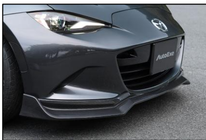
フロントアンダースポイラー

AutoExeの象徴ともいえるハイノーズデザインと、翼端部のウェッジシェイプを融合。流麗かつ力強いフォルムへと進化し、フロントビューに確かな存在感を与える。CFRP(ドライカーボン)製。