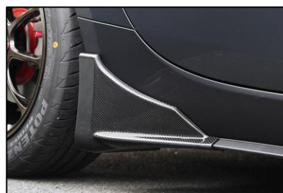
サイドストレーキ

AutoExeの象徴ともいえるハイノーズデザインと、翼端部のウェッジシェイプを融合。流麗かつ力強いフォルムへと進化し、フロントビューに確かな存在感を与える。CFRP(ドライカーボン)製。