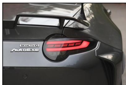
LEDリアコンビネーションライト

ダクトモチーフを取り入れ、風の流れをデザインとして表現。リアセクションにスポーティなアクセントをプラスする。(スノーフレイクホワイトパールマイカ/ソウルレッドクリスタルメタリック/マシニンググレープレミアムメタリックの塗装済品を設定)