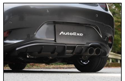
リアアンダーパネル

ワイド感と躍動的なフォルムが印象的なハーフ・フローティングタイプ。確かな存在感を放ちながらも、派手すぎない上質なスタイリングを追求した。CFRP(ドライカーボン)製。