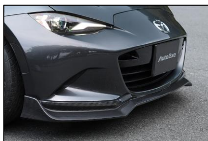
フロントアンダースポイラー

AutoExeの象徴ともいえるハイノーズデザインと、翼端部のウェッジシェイプを融合。流麗かつ力強いフォルムへと進化し、フロントビューに確かな存在感を与える。CFRP(ドライカーボン)製。