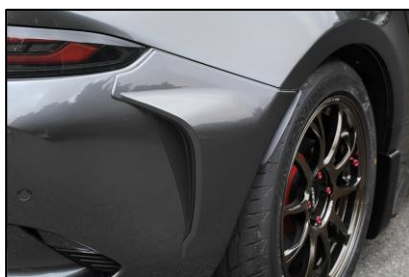
リアサイドカウル

整流効果を意識したデフューザー形状を採用。リアウイングとの組み合わせにより、リアビューをピュアスポーツカーらしく際立たせる。塗装不要のブラック梨地仕上げ。