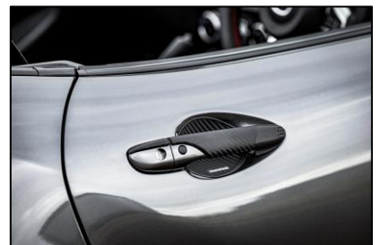
ドアハンドルカバー&プロテクターセット

メタル感を放つメカニカルなワンポイントアイテム。量産フューエルリッドカバーに両面テープ装着。