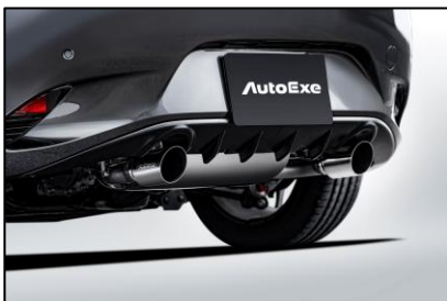
スポーツマフラー&マフラーガーニッシュ

レーシングカーなどに用いられるドライカーボン製。際立つAutoExe立体ロゴと共に、本格的な佇まいを後続車にアピールする。