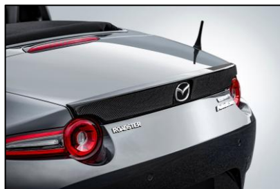
トランクスポイラー

エアダクトのモチーフがアクセント。ハイノーズや前進翼端を織り込んだ躍動的なフォルムが流麗な力強さを添える。ピアノブラック塗装済み。