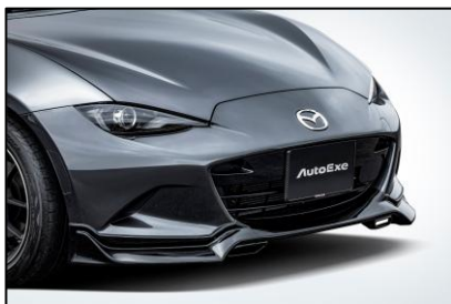
フロントアンダースポイラー

エアダクトのモチーフがアクセント。ハイノーズや前進翼端を織り込んだ躍動的なフォルムが流麗な力強さを添える。ピアノブラック塗装済み。