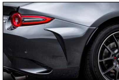
リアサイドカウル

リアルカーボンとピアノブラックのコンビネーションによりスポーツマインドを静かに主張。量産トランクの流れを伸びやかに表現したシンプルな佇まい。