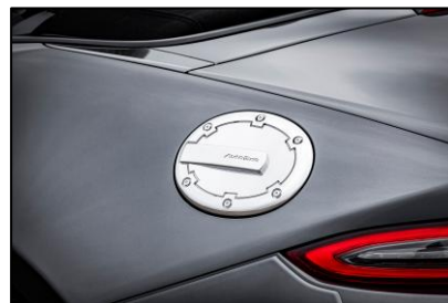
フューエルリッドカバー

さりげないフィン意匠を配したカーボン調マット仕上げでボディを精悍に引き締める。AutoExeロゴステッカーを付属。両面テープ装着。