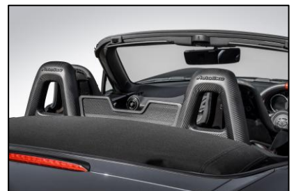
カーボンシートバックバーベゼル

ダクトのモチーフにより風の流れを大胆にデザイン。スポーティなアクセントを与える。(塗装済みも設定有)