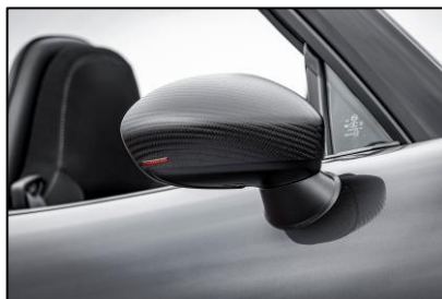
ドアミラーカバー

マフラーガーニッシュと同時装着する左右2本出し仕様。ストレート構造サイレンサーによるジェントルかつ淀みないサウンドが魅力だ。