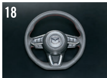
18 スポーツステアリングホイール