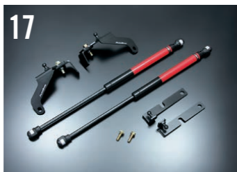
17 ボンネットダンパー