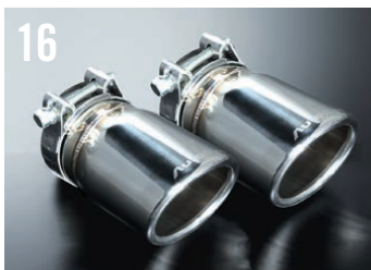
16 エグゾーストフィニッシャー